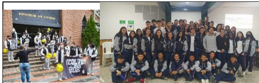
Presentación clase de graduandos