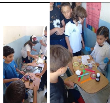
Día de la ciencia