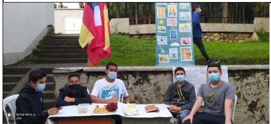
Exposición de Países