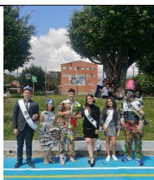
Manejo del reciclaje