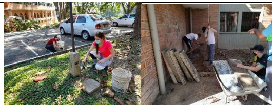
Jornada de amor por ICOLVEN por los Docentes