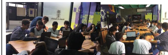
Visita al valle del software