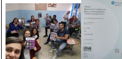
Curso y certificación en inglés para docentes. Uso adecuado de la voz